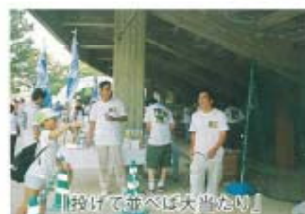
「投げて並べば大当たN」