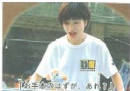
「お手本のはずが、あれ？」