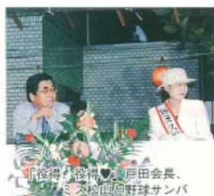
「後得!後得♥ 戸田会長、 又松山同野球サンバ」