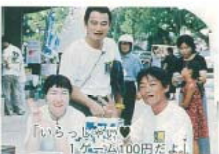
「いらっしゃい♡ 1ゲーム100円だよ！」