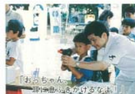
「おっちゃん、 耳は思ふさかけるなよ!」