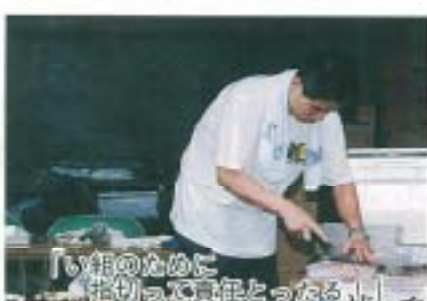
「い組のぬめに 生けて、責任とったるし！」