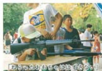
「おちったおもちゃは危ない!」