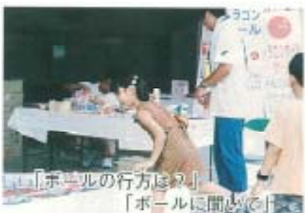
「ボールの行方は？」 「ボールに聞いて！」