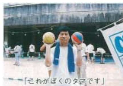
「それがぼくのタマです」