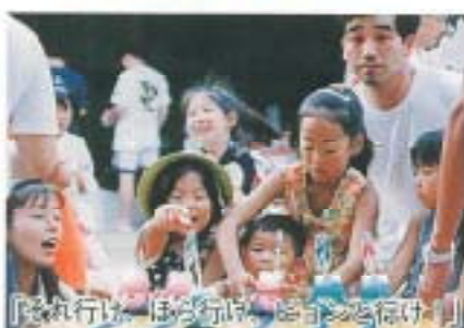
「それ行け、ほら行け、ほら行け！」