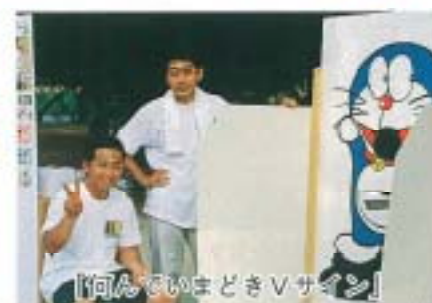
「何んていいまどきVサイン」