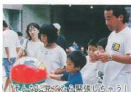
「そんなに見てたら緊張しちゃう」