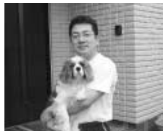
自宅前で「プリン」ちゃんと

子どもの頃から何匹も犬を飼つてきましたが、室内で飼つたのはこれが初めてです。室内で飼うと本当に家族の一員になり可愛くてしかたありません。