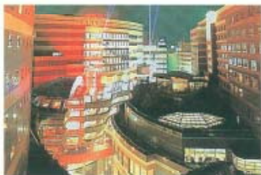
キャナルシティ博多

後期事業としては、「研修旅行」を担当させて頂いたいたします。委員会、役員会での度重なる検討の結果、十一月一三・二四日福岡研修旅行に決定しました。注目の都市開墾地域チャンネルシテイの視察をはじめ、充実した旅行にしたいと考えています。各委員の皆様積極的に参加をお願いします。また、県大会で行った分科会事業「商店街の活性化」「観光の活性化」についても各単会との連携や今後の継続事業への取り組みを検討していきたいと考えています。