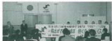
県大会をPRする八幡浜YEG

例会終了後、同ホテルにて懇親会を開催し、新体制のメンバー紹介等を行い会員相互の親睦を深めた。