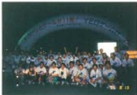
おつかれさまでした！

「おいしいとただけ一番しぼり……今が飲みごろ、よく冷えて、うまいソー」タミ声はりあげ、なれぬ手つきでビールをついだ。用意した樽生ビールが足りず追加を届けさせた。 非常につかれた3日間。充実した3日間。来年も頑張る3日間。スタッフ増員を要求！戸田 善丈