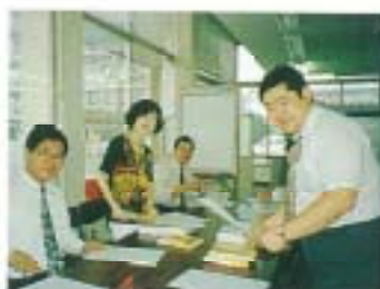
広報紙「遊心」の会員への発送も委員の手で...

広報委員会では、広報紙「遊心」の発行のみの委員会ではなく、商工会議所報への活動状況の掲載(毎月)、ビジネスえひめ誌でのY.E.G事業案内、会員増強記事(毎月)、また松山まつりのビデオ自作作成など松山Y.E.Gの対外的広報を目指す委員会として意識をもって取り組んでいます。