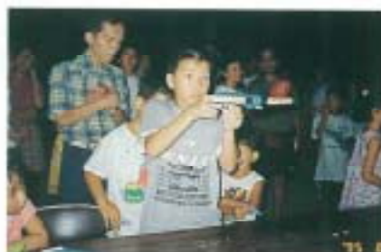
ねらって、ねらって