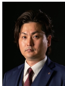
副会長 女性活躍推進委員会