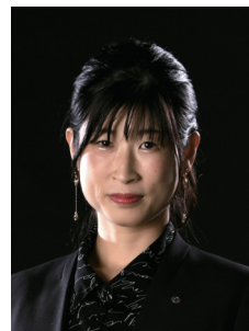
副会長 渉外・交流委員会