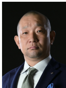
副会長 総務・例会委員会