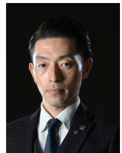
副会長 広報委員会